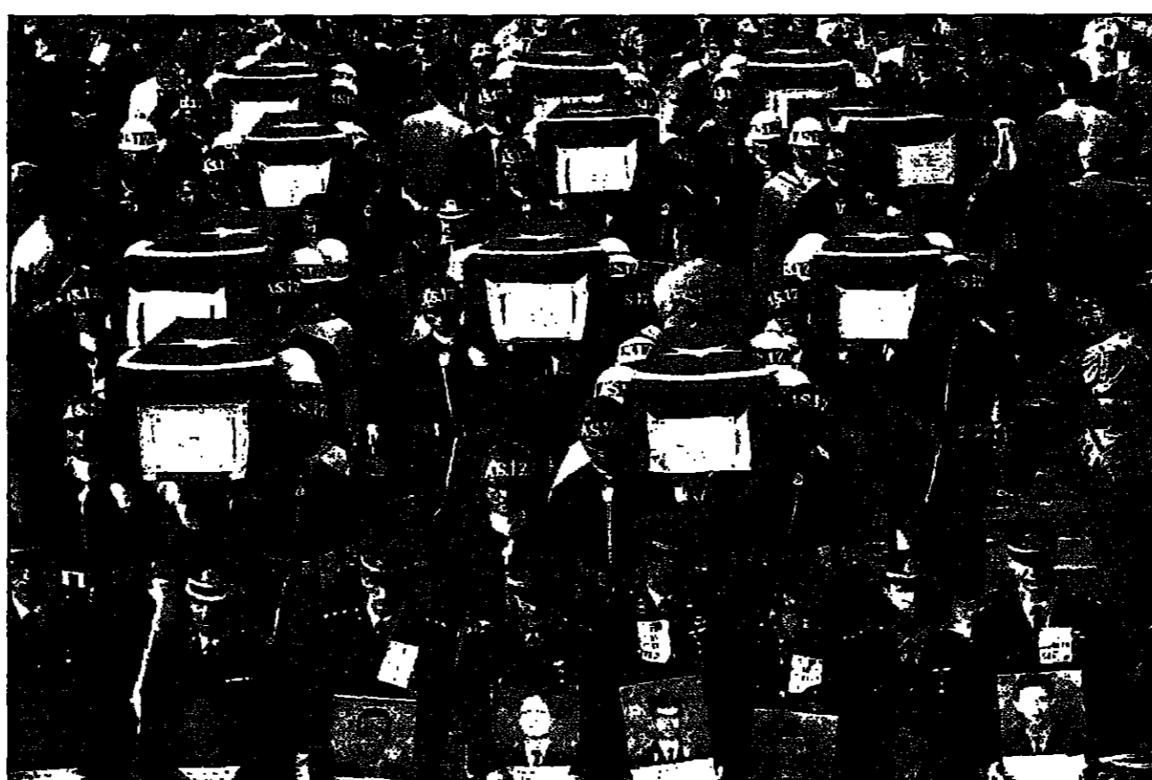
جنود عسكريون للجنود الذين قتلوا بحملاتهم

بيروت - ويذكرت قالت منظمة العفو الدولية بالأفراج عنه. ووصفت منظمة العفو الدولية بالاعتقال (54 عاما) بأنه سجين فكري. وقالت لجنة من خبراء حقوق الإنسان في بيروت أن التوصل لحل وسط في أزمة الاتحاد العمالي في لبنان. وتأتي التوصل في إطار الجهود التي تبذلها لبنان لتوطئ العلاقات مع دول المنطقة. وتأتي التوصل في إطار الجهود التي تبذلها لبنان لتوطئ العلاقات مع دول المنطقة.